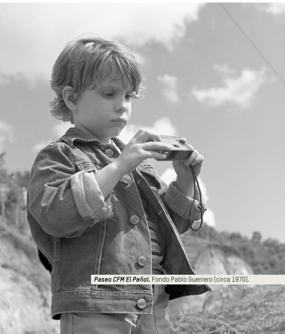
Paseo CFM El Peñol. [circa 1970].