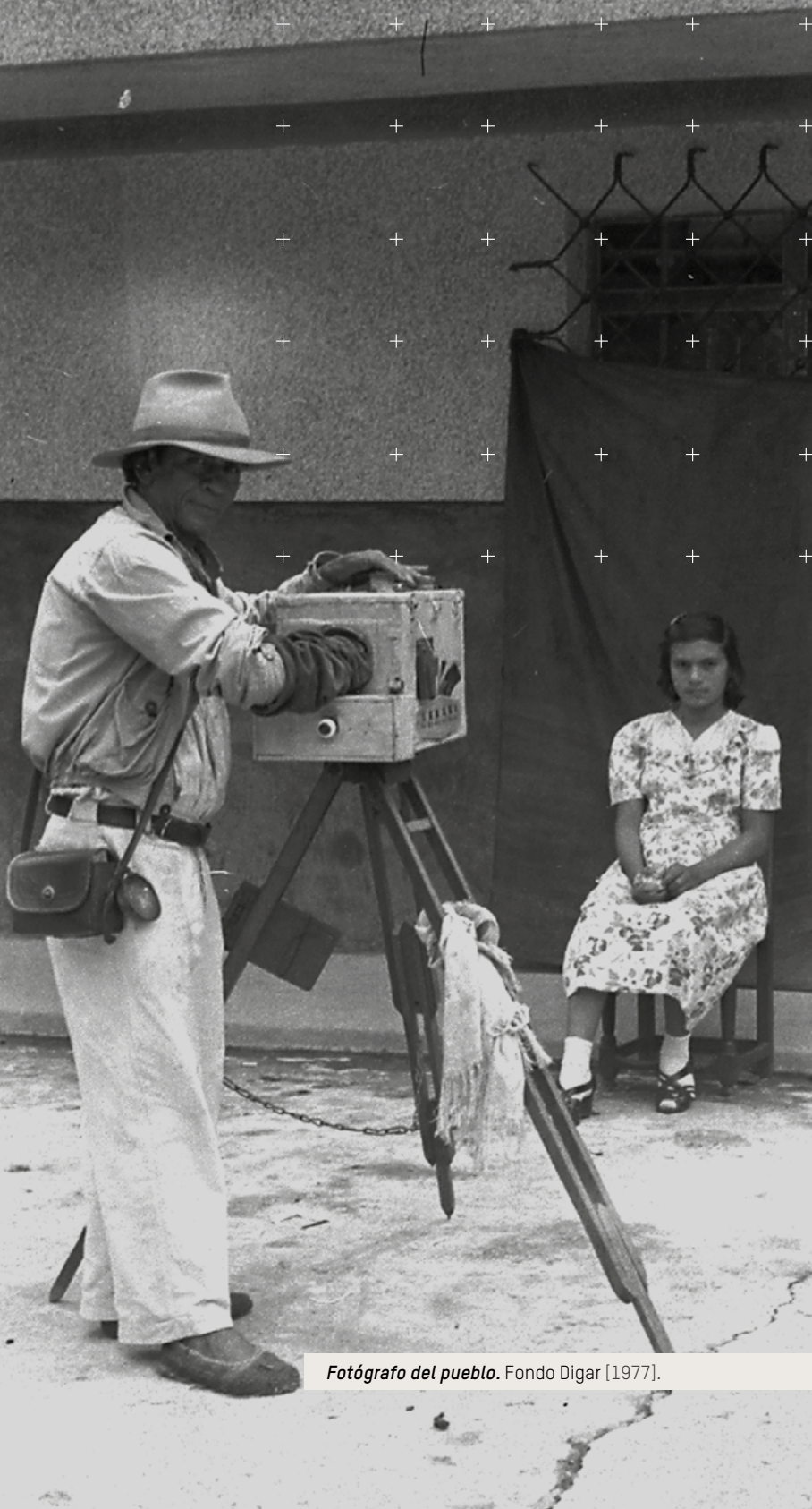
Fotógrafo del pueblo. Fondo Digar [1977].